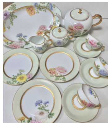
77回記念千葉忠明賞 磁器絵付「明治洋食器に憧れて」 泉 千鶴(茨城)