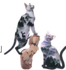
茨城県知事賞 ニードルフェルト「希望の夜明」 熊木早苗 (埼玉)